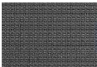
087087 plum slate