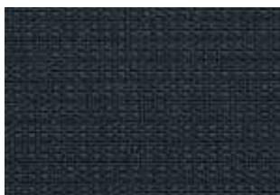
095095 royal blue